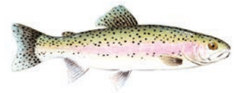
TRUCHA ARCO IRIS

* La trucha arco iris se siembra durante los meses de invierno.