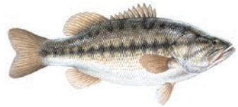
LOBINA BOCA GRANDE